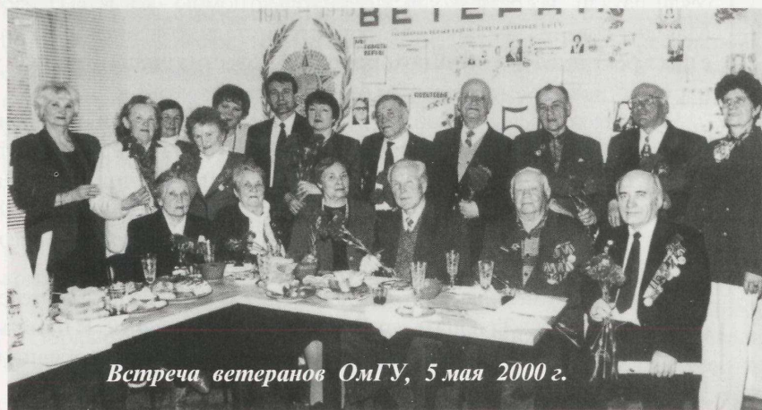
Встреча ветеранов ОмГУ, 5 мая 2000 г.

От всей души желаю Вам успешной работы и всего самого доброго!