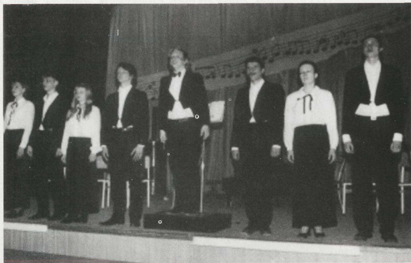
Сцена из спектакля «Ленинградская симфония».

Редактор: заслуженный работник культуры РФ. Н.А.Козорез. Редакционный совет: Сопредседатели совета - Г.И.Геринг, В.В.Радул, Н.А.Томилов. Члены совета - П.П.Вибе, В.В.Дубицкий, С.Н.Поварцов, А.П.Сорокин, В.И.Струнин, М.М.Хахаев. Издательство ОмГУ. Тираж 999. Бесплатно. Заказ №284.